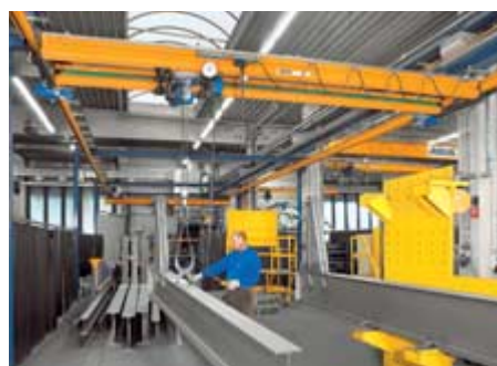
Optimálne využitie priestoru vďaka dvojsníkovému žeriavu ABUS ZHB-X s podvesným žeriavom