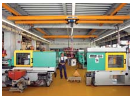
Dvojsníkový žeriav ZHB