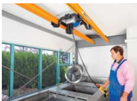
Dvojkolajnicová dráha ABUS ZSB