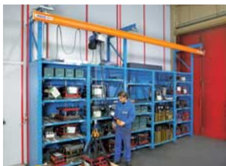
Jednokoľajnicová dráha ABUS ESB

. . . ponúkajú flexibilné riešenie jednosníkové žeriavy ABUS EHB a ABUS EHB-X a dvojsníkové žeriavy ABUS ZHB, ABUS ZHB-X a ABUS ZHB-3. Svoje individuálne prednosti – od nízkej vlastnej váhy, cez nízku konštrukčnú výšku až po priaznivú výšku zdvihu vďaka umiestneniu reťazového kladkostroja medzi nosníky – Vám predvedú i v halách s komplikovanými podmienkami.