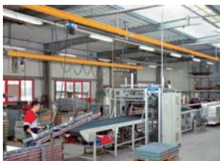
Dve paralelné jednokoľajnicové dráhy ABUS ESB