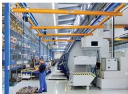
Jednosníkový žeriav EHB